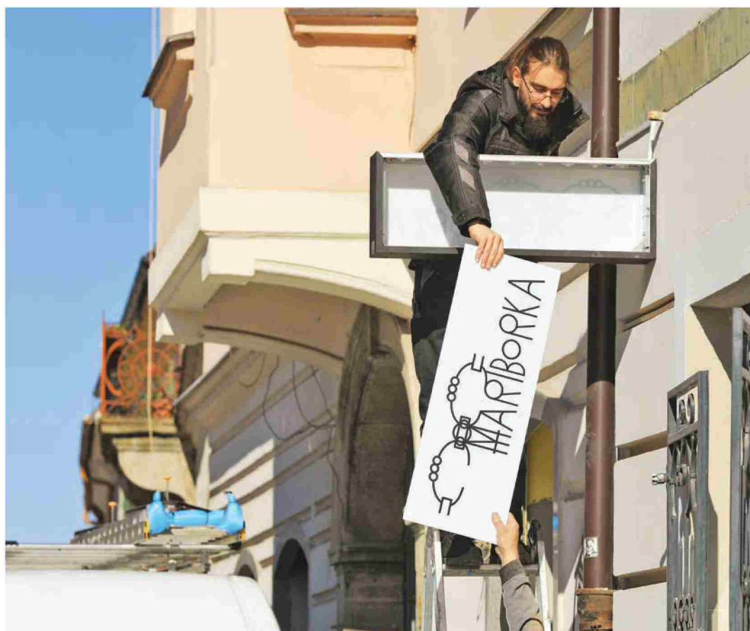
To soboto se v 16,7 kvadratnega metra velikem (ali pa majhnem) lokal(čk)u odpira Mariborka. Knjigarna Mariborka.